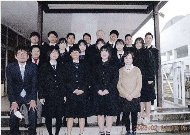
23期生クラス幹事と同窓会代表メンバー