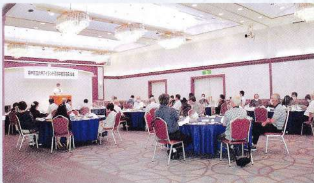
待ち望んでいた総会を3年ぶりに開催する事ができました!