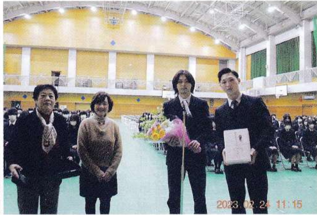
学年代表の2人に花束と記念品を贈呈