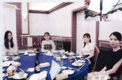
久しぶりに楽しくお喋り、嬉しい!!