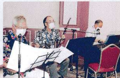
琉球トリオの名演奏