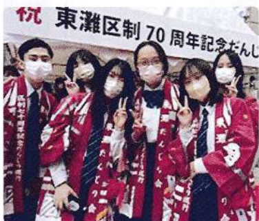
笑顔のメンバーです

六アイ校がある神戸市東灘区が区制70周年を迎えました。 それを記念して開催する「だんじりパレード」の法被と浴衣のデザインが学校に!! 令和4年10月9日(日)