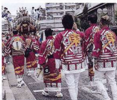
斬新な若さあふれるデザインでした