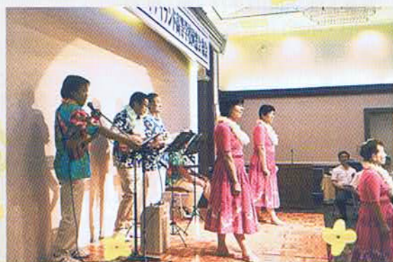
神戸にいなからハワイリゾート気分も味わえました