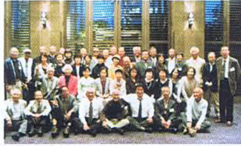
写真は平成24年オリエンタルホテル開催分

15年前、還暦を迎えた年に同期会を開催以来、毎年継続しています。初回は、参加者も80名ほどで大いに盛り上がりましたが、回を重ねるうちに減少しているのが実情です。それでも、旧交を温めたいと願う仲間の熱意に支えられ、昨年も三宮の「東急REIホテル」に24名が参加してくれました。現在では、6月第3水曜日が開催日となっています。