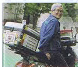
「老いてこそ幼なじみの同窓生交流ありて 元気の源」