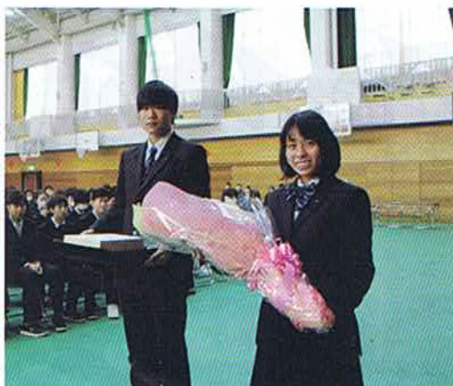
学年代表の2人に花束と記念品を贈呈