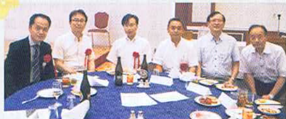
先生 いつもご参加いただき有難うございます