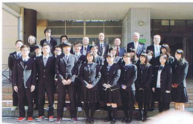
18期生 クラス幹事と同窓会代表メンバー