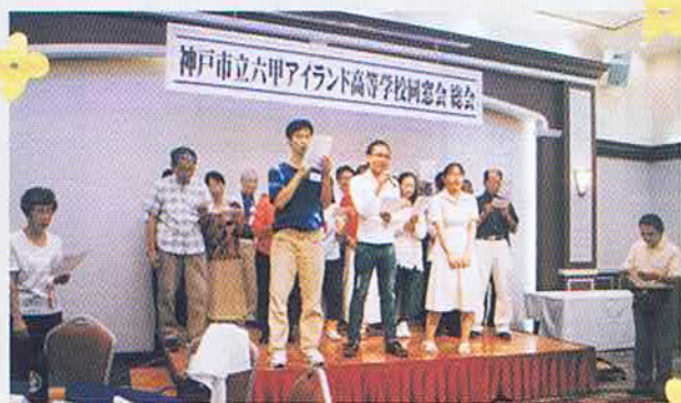
恒例の六アイ高校歌斉唱 老いも若きも心は一つ