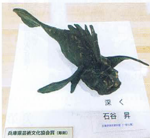
兵庫県美術文化協会賞(彫刻)

井伏鱒二の訳した中国詩に、「花に嵐の たとえもあるぞ」さよならだけが人生だ」 とありますが、私達にある確かなものは 「サヨナラ」だけなのでしょうか。人の生