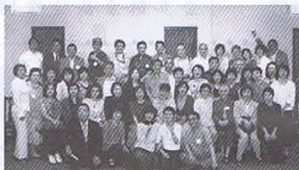
平成21年9月26日 第一楼

平成21年9月26日還暦同期会を開催致しました。卒業以来初めての方、遠くは秋田・山形からも参加され総勢49名となりました。前向きなスピーチ、楽しいエピソードの数々、二次会にも34名の参加がありました。