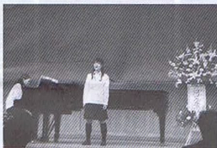
ピアノ・バイオリン・独唱・合唱等本格的な練習に取り組んでるのがよくわかります。