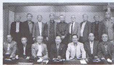
平成21年10月31日 料亭「山田屋」

双龍会平成21年度の同期会は、 今回から会場を料亭「山田屋」に 移し10月31日午後5時から開催、 16人が顔を揃え1年ぶりの再会に 旧交を温めた。