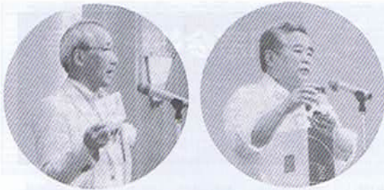
総会の始めに会長・校長あいさつ

校長先生は、国際情報系の女子5人のアイデアでトールクッキーの協力を得て、期間限定で作られたプリン「美女とマンゴー」を紹介