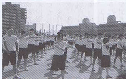
昭和26年に考案された神戸体操。現在では続ける学校は全体の1割しかないとのこと。六アイ高では今も神戸体操に取り組んでいます。