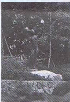
「灯」神戸文化ホールに設置 1976年作

また、清流会80周年記念として赤塚山高校に設置されました「潮騒」は、現在六甲アイランド高校でようやく潮の香を一身に浴びています。遠くから押し寄せてくるものに耳を傾け、心を通わせ、未来を見ずえる姿を表していることなど、像に出会うと様々なことが思い出されます。そして、なぜか像に触れ「こんにちは、元氣？」と声をかけてしまうのです。創作活動と神戸女子短期大学で教師生活をしておりましたが、昨年、教授職を退きフリーになりました。