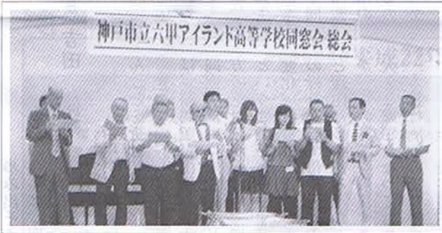
最後に六アイ校歌など皆で合唱