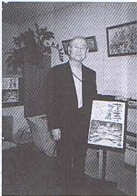
2010年4月28日～5月1日、菅屋のギャラリー篝火にて個展

教員退職(1984年3月)後その夢に向かつて第2の人生を歩みました。4月には、長野県南安曇野穂高町にアトリエ「工房の森」を開設し、数々の個展を各地で開いてきました。1995年阪神大震災を機に西宮に戻って来てからも毎年、個展を開いています。今年、菅屋で開き神商の教え子はじめ300人程の方々に来て頂き感謝の思いでいっぱいです。