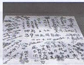
平成22年4月25日 遊あい亭