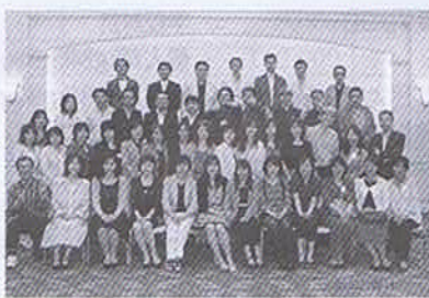
平成22年5月3日 神戸東急イン

1980年3月卒業後、3回目となる学年同窓会を、卒業30周年記念として、5月3日に神戸東急インで47名が参加し、30年ぶりによりがえる大爆笑。も含めて、超楽しく開催できました!