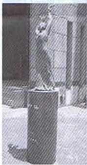
「潮騒」六甲アイランド高校正面入り口前 1992年作