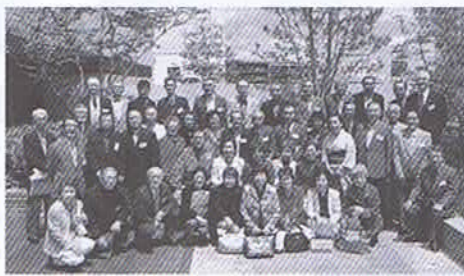
平成22年5月13日 ANAクラウンプラザホテル神戸

5月13日(木)五月晴れのもと、「ANAクラウンプラザホテル神戸」において、同窓会を開催しました。