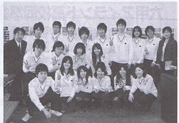
同窓会室にて —学年主任の先生と幹事18名の皆さん—