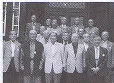
平成22年5月25日 東天閣

「八十路越え 余生楽しむ トツパくらぶ」との誘いに元氣な お顔が揃った18名、誰かがトツパ と同じ人数だねと言っていた。 今回は老舗、異人館の東天閣で 平成22年5月25日に開催、毎年集 まる顔ぶれだがお互い余生を楽し みつつ、亡き会友の思い出や、欠 席者の会友を案じ乍ら話は尽き ず、予定の時間になり、龍神ヶ丘 の校歌を力強く合唱し、来年の再 会を約し散会した。