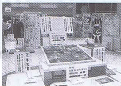
速報「第24回毎日・DASデザイン賞」 コンクール学校賞受賞・全国団体1位 - 7年連続学校賞受賞 -