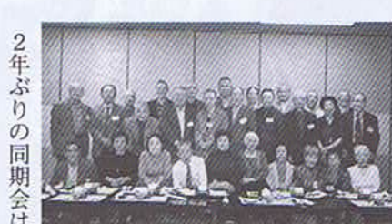
平成21年10月24日(土) 「とけいや」阪急三宮駅山側 会費 8,000円