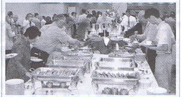
バイキング料理で満腹！満足！

皆さんも同期会兼ねて参加されたいいかですか？ 多人数の場合事前に必ず事務局にご連絡下さい。