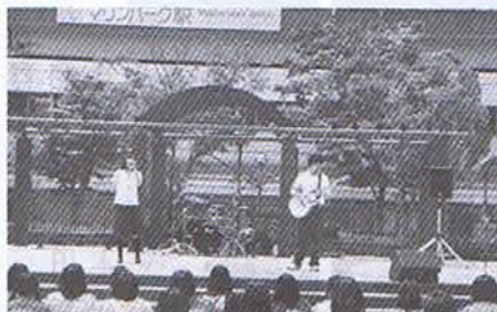
今年も晴天に恵まれ野外では生徒会アワーで、各グループが個性溢れる歌・ダンスを披露しました。