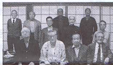
平成22年4月18日 しあわせの村

「世の移り変わりの早さは は…」などと言いながら神戸しあ わせの村の大温泉にゆつくりと浸 かり、その夜はあの懐かしい龍神