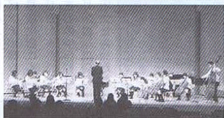
少人数ながら地道な練習を重ね市内の小学校や保育所、老人ホームへの訪問演奏等活発に演奏活動をしています。