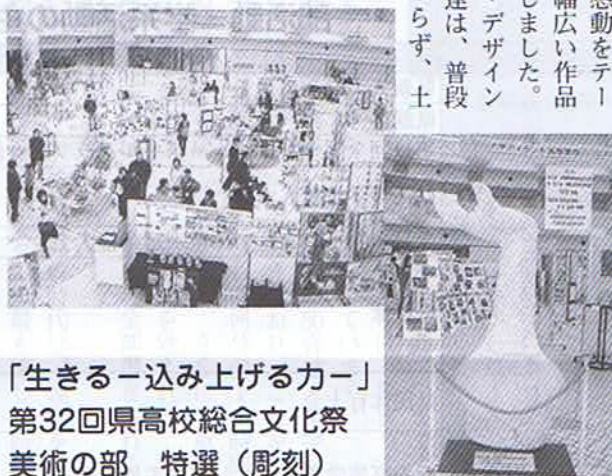
「生きる-込み上げるカー」 第32回県高校総合文化祭 美術の部 特選(彫刻)

芸術系美術・デザインコースの生徒達は、普段の授業のみならず、土曜・日曜や長期休業中もほとんど休むことなく作品制作に取り組んできたそうです。見ごたえのある作品ばかりでした。