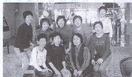
▲平成21年4月11日~12日 有馬瑞宝園で

ミナの会有志が集い有馬のさくら祭りを楽しみました。しだれ桜・ソメイヨシノ等満開の桜を見ながら町を散策し、夕食時は何時までも尽きないおしゃべりに花を咲かせ、その後2組に分かれ、カラオケ組は歌姫になったり、友人の歌声に聞きほれストレス解消。入浴後は一室に集まり、和布のブローチを作る人、話の続きを楽しむ人、ぐっすり寝る人と皆思い思いに命の洗濯をしました。