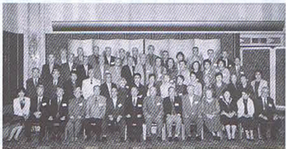
▲平成20年10月26日 ホテル・ニューオータニで

同期会楽しく過ごしていただきましたでしょうか？私たちが、初めて出会ったのは、60年前の4月、湊川高校の入学式でした。初