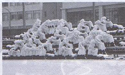
秋晴れのもと 男子生徒が勇壮に 騎馬戦