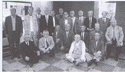
▲平成21年5月10日 六甲荘で

今年の十九生会は去る5月10日六甲荘で開催、お互いの趣味や健康状態と孫達の成長振り等を中心に大いに語り合い、カラオケも加わり一段と盛り上がった。来年は卒業65周年になるので、全員元気で再会することを約束した。