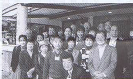
▲平成21年3月22日(日) 異人館通り「カフェテラスドバリ」で