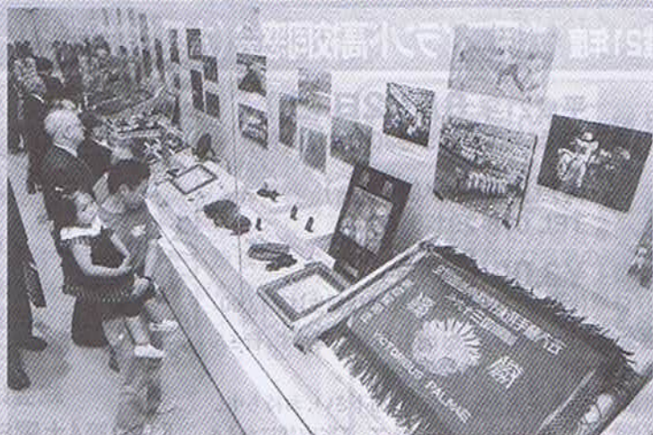
平成20年5月31日付け 朝日新聞

私は、昭和30年の兵庫大会を野球部OBとして一回戦より応援に行っておりました。優勝戦は甲子園球場で県立明石高校との対戦で実に劇的な優勝でした。第三神港商業野球部創設以来の念願が達成された記念の日で、全国大会は東京代表の日大三高との対戦でした。一点差で後攻だったので逆転又は延長に望みをかけましたが得点に至らず敗退、県大会全国大会で優勝するには厳しい練習による優れた技術、強靱な身体、不屈の精神力、責任感、それに恵まれた幸運が勝利への道であると感じました。六アイ野球部大いに期待する。