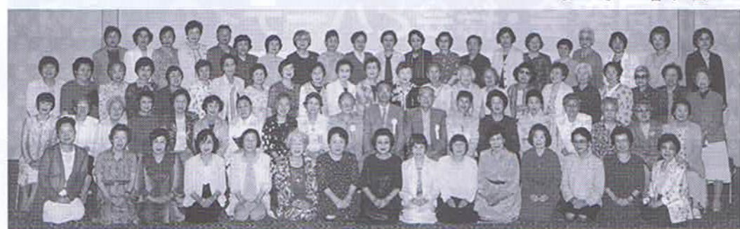
▲平成13年5月25日 於 ホテルオークラ神戸